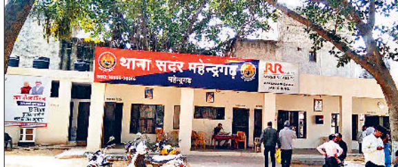
महेंद्रगढ़। सदर थाना भवन।