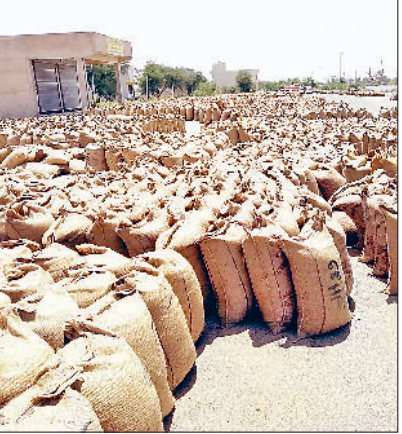
नारनौल। खरीद बंद होने पर मंडी गेट पर छाया सन्नाटा व उठान नहीं होने से मंडी में रखे सरसों के बैग।