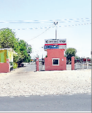
नारनौल। खरीद बंद होने पर मंडी गेट पर छाया सन्नाटा व उठान नहीं होने से मंडी में रखे सरसों के बैग।

सरसों की सरकारी समर्थन मूल्य पर खरीद गुरुवार से बंद कर दी गई है। जबकि करीब एक माह से ज्यादा समय तक चली खरीद से जिले में लगभग 14 लाख 88 हजार 190 विंटल सरसों की खरीद की गई है। अब सरकारी समर्थन मूल्य पर खरीद बंद होने के पश्चात मंडियों में व्यापारी खुली बोली के आधार पर सरसों की खरीद कर सकेंगे। मंडियों में फिलहाल सरसों 4600-5000 रुपये तक प्रति विंटल की दर से खरीदी जा रही है, जबकि सरकार ने सरसों का सरकारी समर्थन मूल्य 5650 रुपये विंटल घोषित किया हुआ था। इस अवसर पर किसानों ने जमकर लाभ उठाया है और इस बार केवल नई ही नहीं, दो-तीन साल पुरानी सरसों भी किसानों ने निकाल दी। अक्सर एक अप्रैल से शुरू की जाने वाली रबी सीजन की